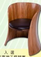
入選「2021臺灣工藝競賽」 「正襟為座」