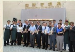
「木質層積材創意商品推廣發表會」推廣國產木材的好