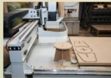
CNC加工機裝機完成後實際操作情形