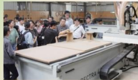
木材利用工廠接受企業捐贈1部CNC加工機