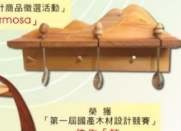
榮獲「第一屆國產木材設計競賽」佳作「虹」