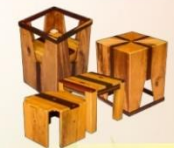
榮獲「2015廢棄木材創意競賽」 全國第二名「聚.1>3」